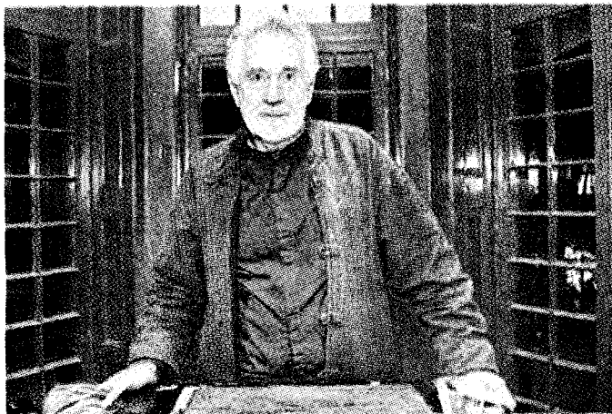
Breyten Breytenbach, nato nel 1939, è stato in carcere dal 1975 al 1982

Tornano «Le confessioni di un terrorista albino»: un secco realismo si trasforma in simbolo, non di rado onirico