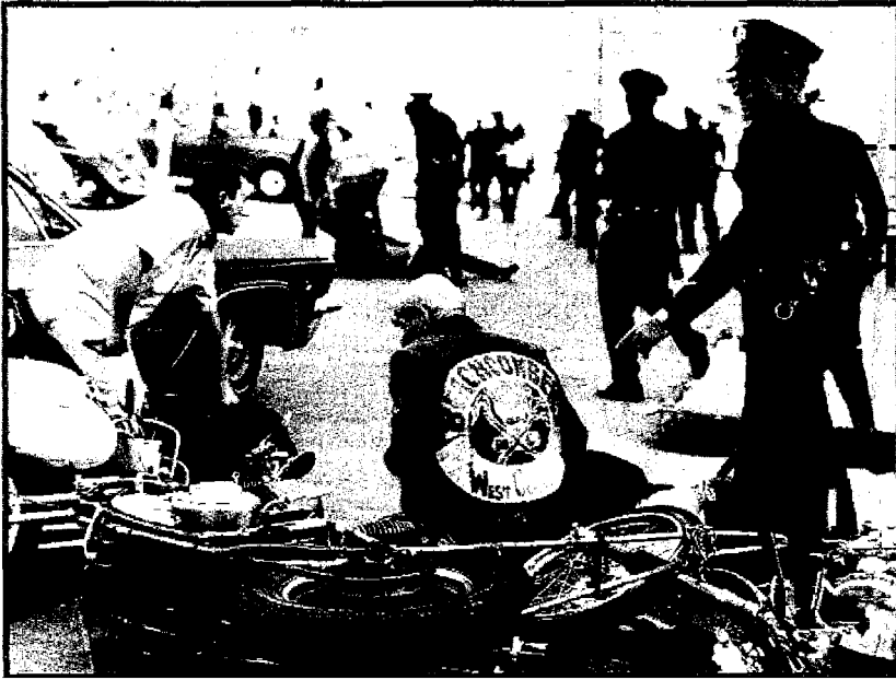
Sopra, immagini di New York anni 50: nel suo DNA un popolo di "sotterranei"