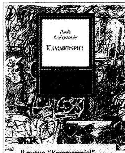
Il nuovo "Kammerspiel"